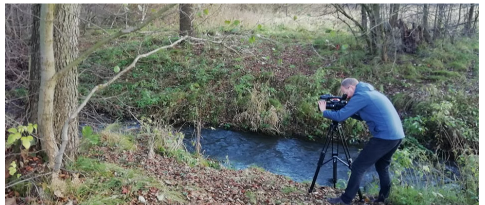
Natáčení v Jablonném v Podještědí

Projekt spolufinancován ze Státního fondu životního prostředí České republiky na základě rozhodnutí ministra životního prostředí.