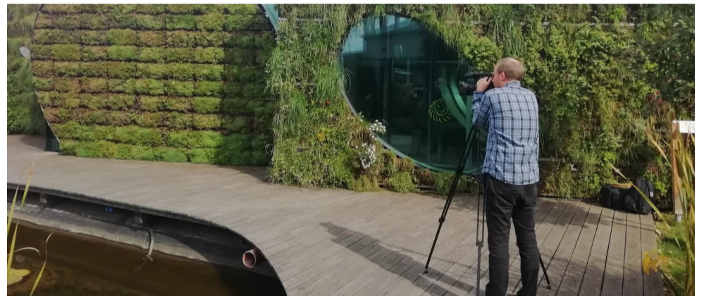
Natáčení v LIKO-S ve Slavkově u Brna