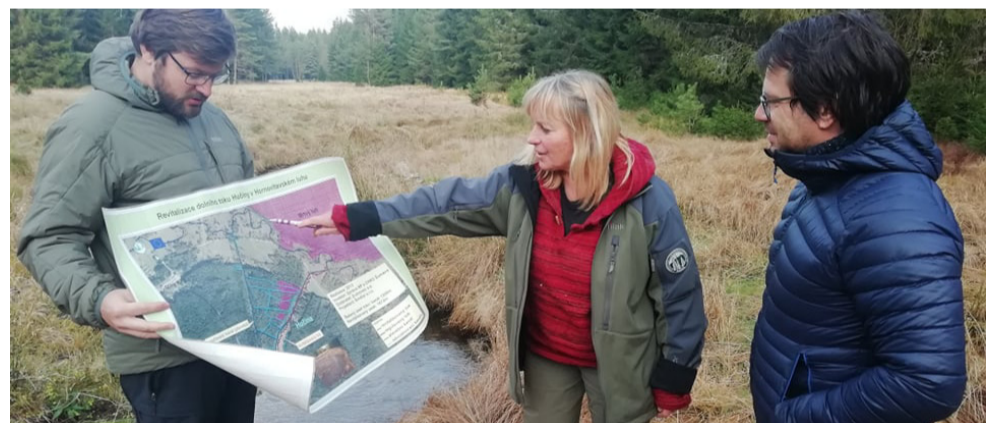
Natáčení v NP Šumava